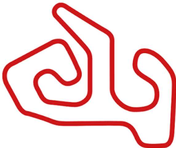
Figură 1 Varianta aleasă de circuit pentru RMC4

1.699 m; sensul de parcurgere: sensul acelor de ceasornic.