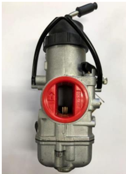
Figură 2 Restricor pentru categoria ROTAX MINI MAX

-Anvelope MOJO D5 Prime (slick) și W5 CIK (rain) admis - 1,5 set slick, 1 set rain (se va utiliza scanarea și marcarea)